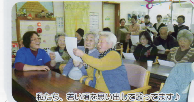
私たち、若い頃を思い出して歌っています♪