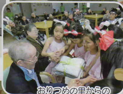
おりつめの里からの 雑巾のプレゼント。