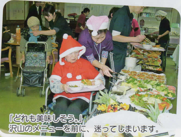
『どれも美味しそう。』 沢山のメニューの前に、迷ってしまいます。