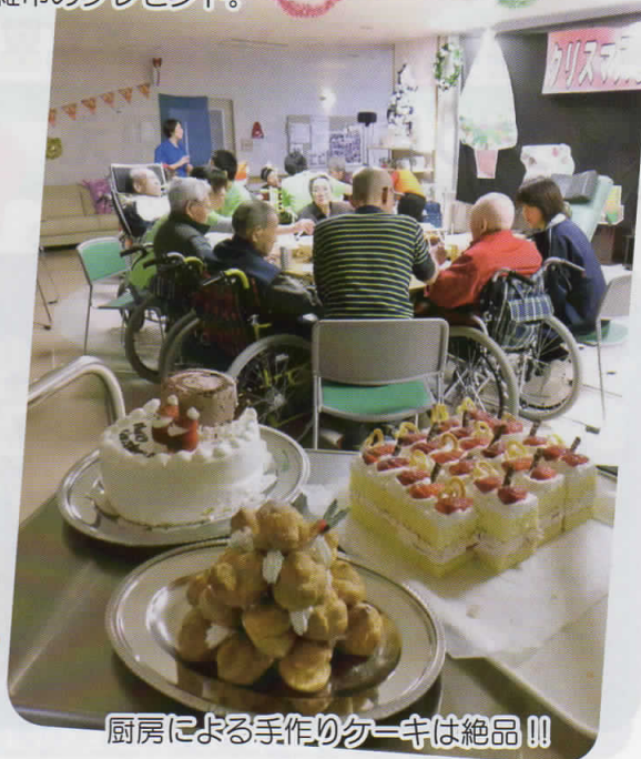
厨房による手作りケーキは絶品!!