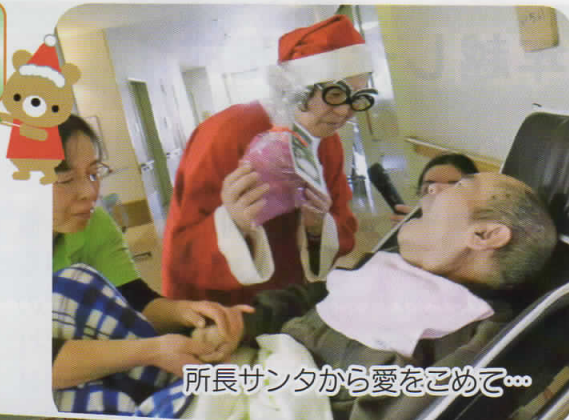
所長サンタから愛をこめて...