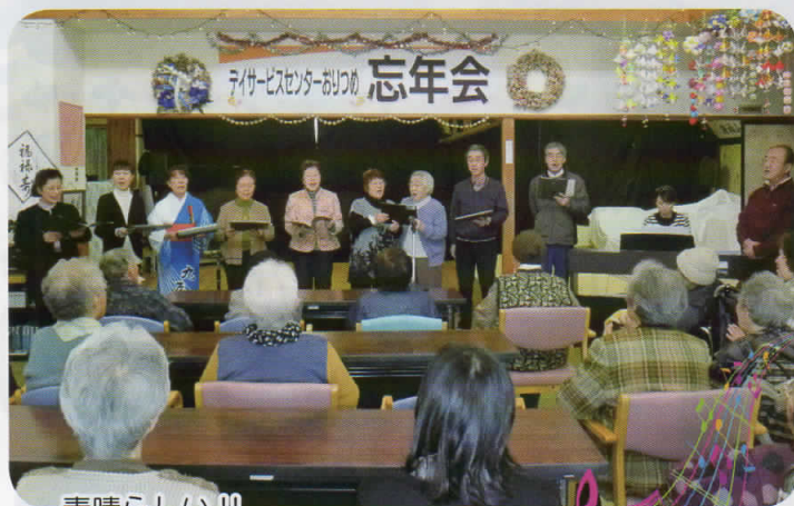
素晴らしい!! コールはまなすの歌声!!