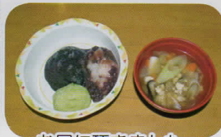
お昼に頂きました。