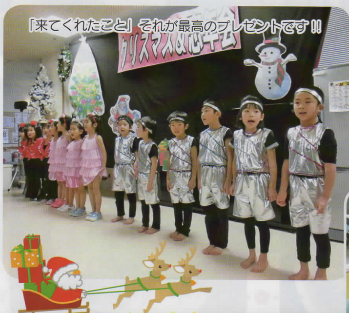
「来てくれたこと」それが最高のプレゼントです!!