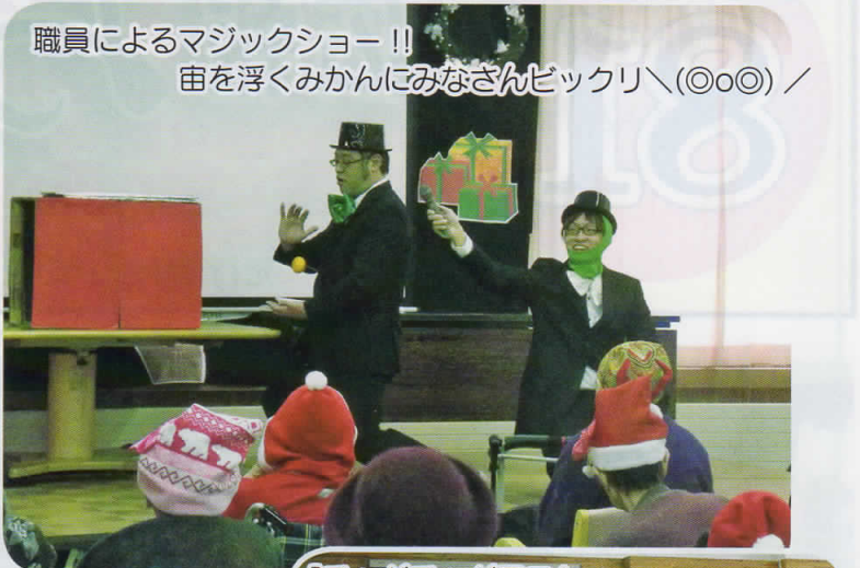
職員によるマジックショー!! 宙を浮くみかんにみなさんビックリ\(\(\circ\circ\)\) /