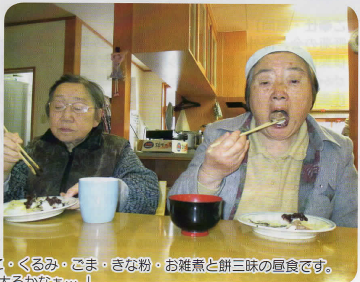
「あんこ・くるみ・ごま・きな粉・お雑煮と餅三味の昼食です。『また太るかなあ…。』」