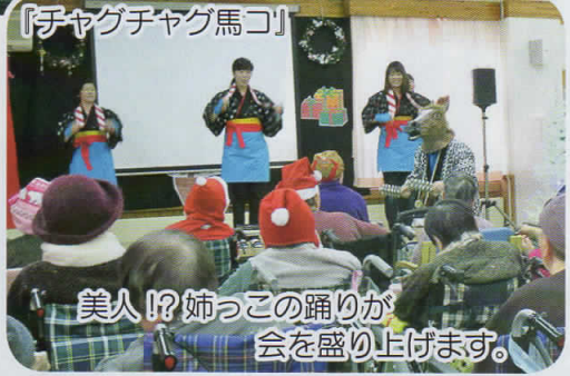
『チャグチャグ馬コ』 美人!? 姉っこの踊りが 会を盛り上げます。