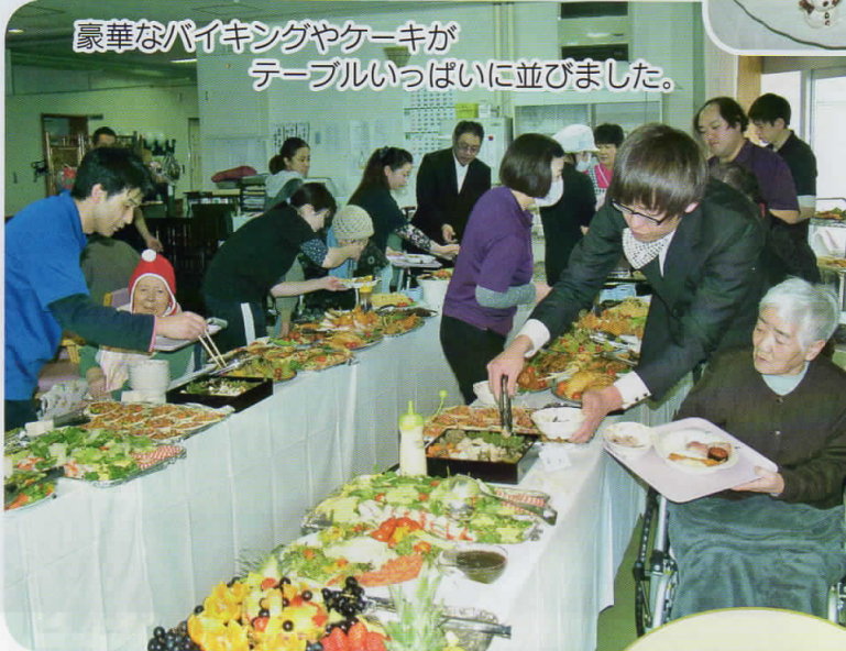
豪華なバイキングやケーキが テーブルいっぱいになりました。