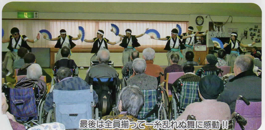
最後は全員揃って一条乱れぬ舞に感動!!