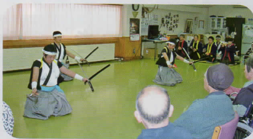
真剣な表情。カッコイイ。