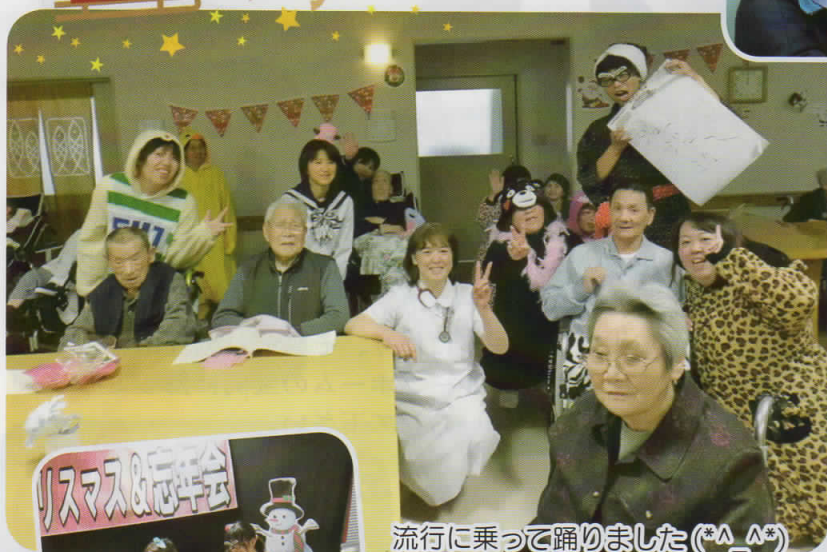
流行に乗って踊りました(*^_^*)