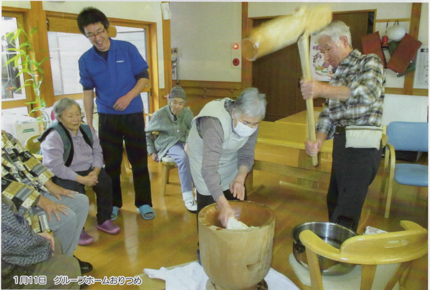
1月11日 グループホームおりつめ