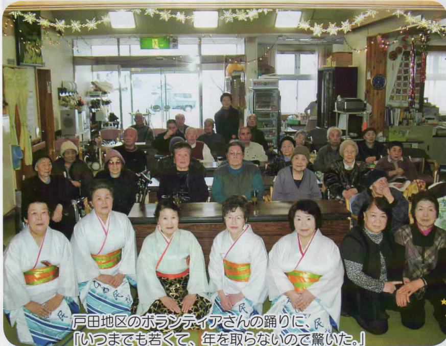
戸田地区のボランティアさんの踊りに、 「いつまでも若くて、年を取らないので驚いた。」 と男性利用者さん。