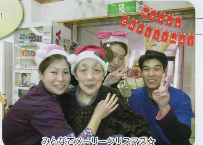
みんなでメーリークリスマス☆