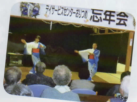
思わず「八戸小唄」を一緒に口ずさみ♪