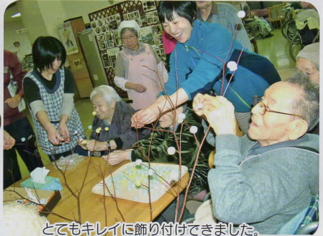
とてもキレイに飾り付けできました。 五穀豊穡、無病息災など祈願しました。