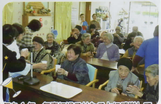
2013年も1年、無事に過ごせたことに感謝して カンパニー!!!