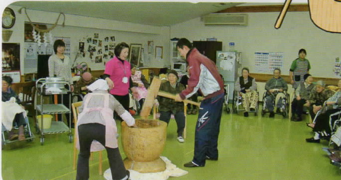
今年も山根小学校から頂いたもち米で餅つきです。 「ヨイショ！ソーレ！ヨイショ！」