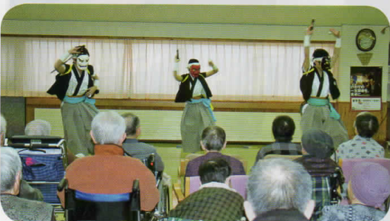
お面さながらの迫力ある舞に圧巻!!

若さあふれる迫力ある舞に、圧巻。そして利用者、職員共に感動。涙を流されている利用者も見られました。