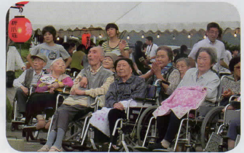
見事な踊りに大興奮!!