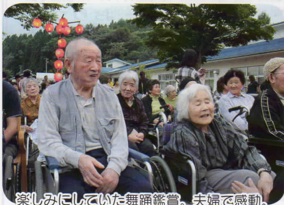
楽しみにしていた舞踊鑑賞。夫婦で感動。