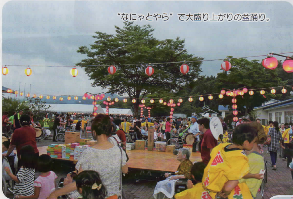
“なにやとやら”で大盛り上がりの盆踊り。