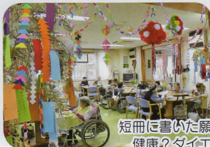
短冊に書いた願いは、健康? ダイエット?