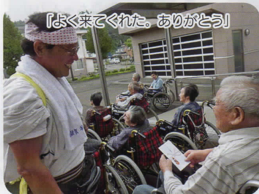
「よく来てくれた。ありがとう」