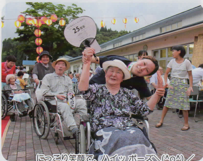
にっこり笑顔で、ハイッポーズ(笑)(笑)