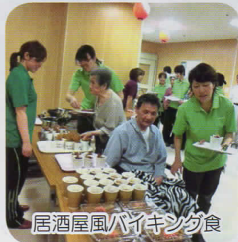
居酒屋風バイキング食