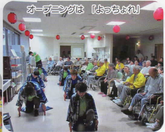
オープニングは「よっちょれ」