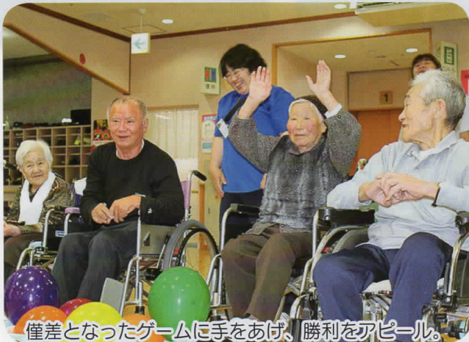
僅差となったゲームに手をあげ、勝利をアピール。