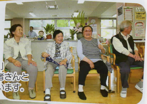
「元気でしたか？」顔見知りの利用者さんと挨拶を交わします。