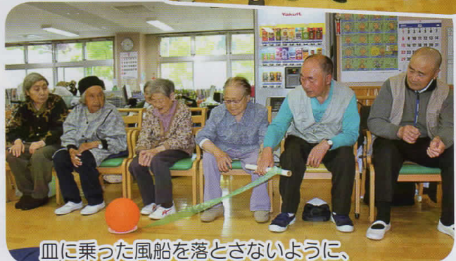
皿に乗った風船を落とさないように、隣の人にバトンを渡します。