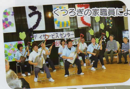
くつろぎの家職員によるスコップ三味線。見事な演奏に、みなさん聴き入っていました。

最後に、手作りおやつをいただき、顔見知りの利用者さんと会話も弾み、お互いの健康とまたの再会を誓って名残惜しみながら会を終えました。