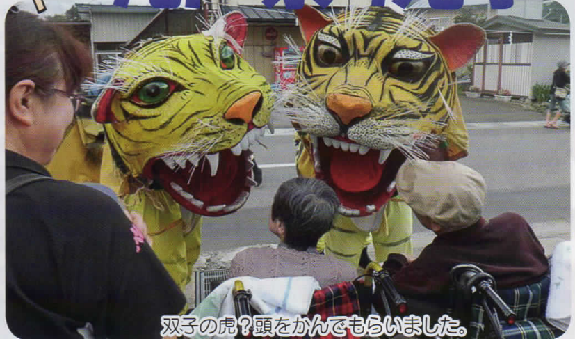
双子の虎?頭をかんでももらいました。

今年も九戸祭り見学をしてきました。ご家族やボランティアに協力を得て17日に7名、19日9名参加し、踊りや山車に感激してきました。嬉しいことはもう一つ、今年からおりつめの里にも門うちが来てくれたこと。多くの入居者の方が楽しむ事が出来ました。