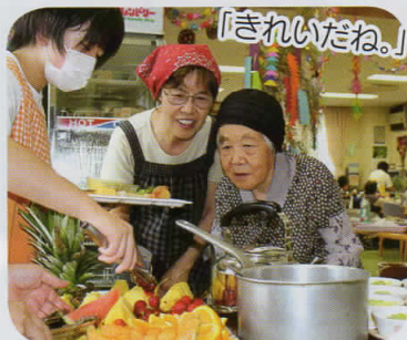
盛り付けの美しさにも感心!!