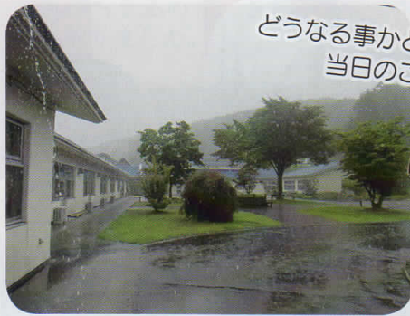
どうなる事かと思った 当日のこの雨...(>_<)