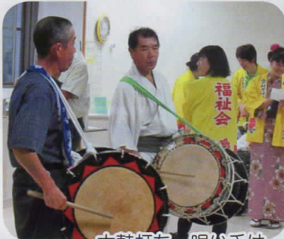
太鼓打ち、唄い手はボランティアさんが担当