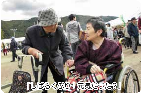
「しばらくぶり!元気だった?」

かぼちゃを背負ったよちよち歩きの幼児や高校生によるえんぶりなどを見学してきました。また、知人に声をかけられ会話を楽しんだり、ひつつみをごちそうになったりと地域の人たちとたくさん関わりを持つことができました。