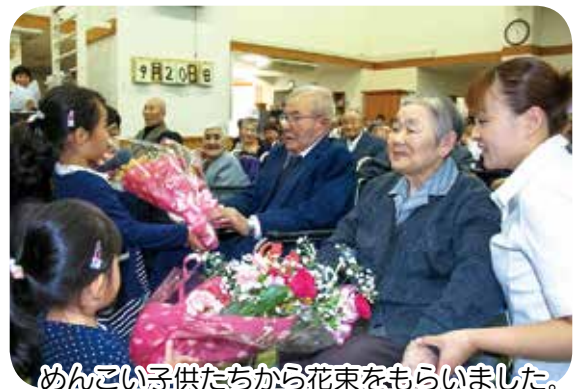
めんごい子供たちから花束をもらいました。