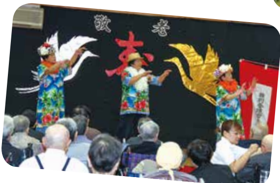
伊保内婦人会の皆さんによる素敵な踊りの数々。