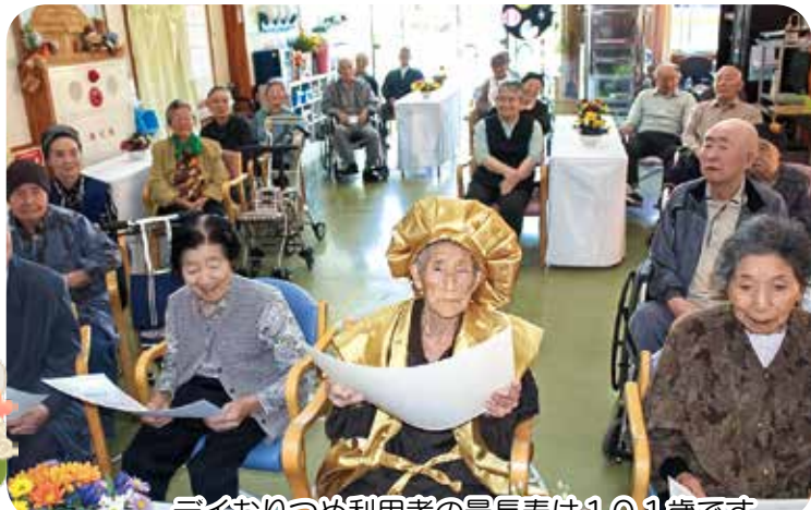
テイおりつめ利用者の最長寿は110歳です。 「ありがたい、ありがたい！」

また、長寿のお祝いでは、昨年と変わらず今年も元気で過ごしてきたことを嬉しく思い、来年への活力へ繋ぐことが出来たと思います。