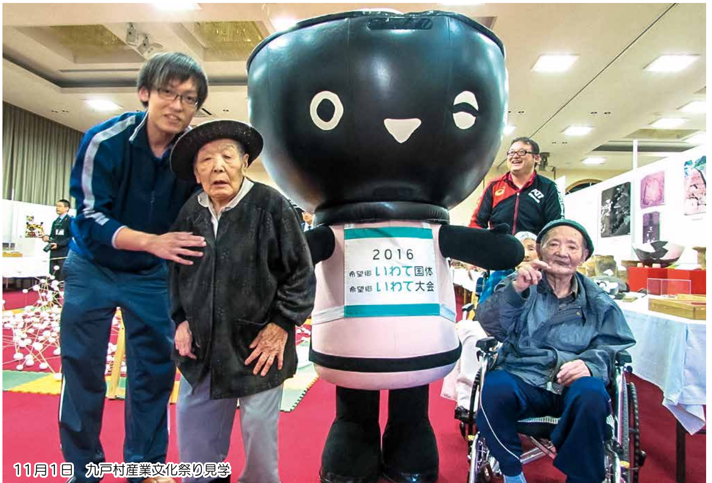
11月1日 九戸村産業文化祭り見学