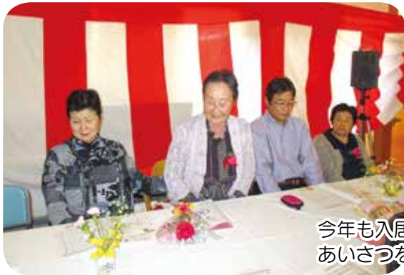
今年も入居者代表し立派なあいさつをして頂きました。