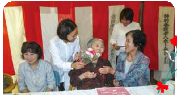
職員より感謝のメッセージと花束を贈ると、涙ぐむ姿も見られました。