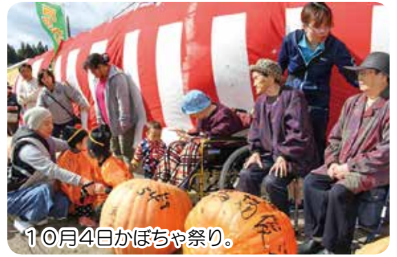
10月4日かぼちゃ祭り。