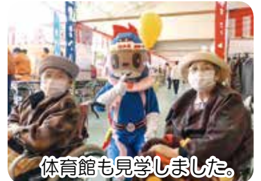
体育館も見学しました。