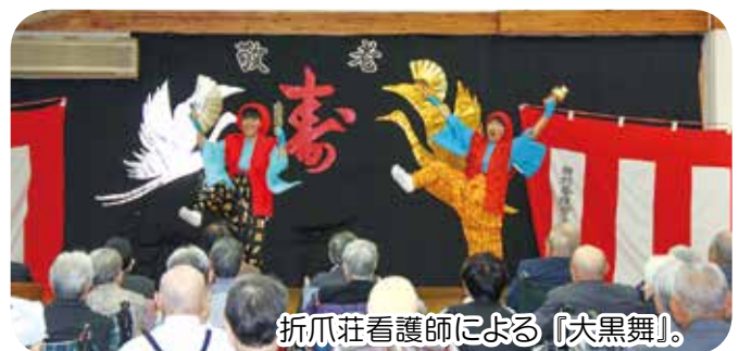
折爪荘看護師による「大黒舞」。