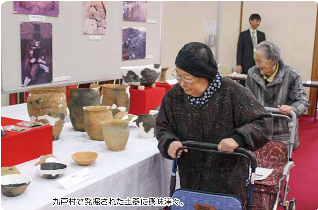
九戸村で発掘された土器に興味津々。