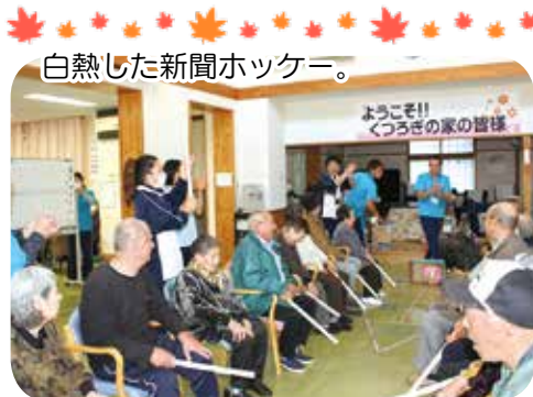
白熱した新聞ホッケー。

お茶の時間では、利用者間の繋がりも強くなり、別れを惜しみながら終了となりました。