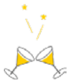
家族みんなと一緒に 食べるご飯はおいしくて、 いつもより食もすすみ、 笑顔もあふれます。