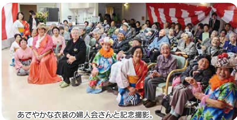
あでやかな衣装の婦人会さんと記念撮影。

式典終了後は伊保内婦人会さんのお祝いの踊りの披露がありました。祝賀会では厨房の作った祝い膳をいただきながら、余興を楽しみました。