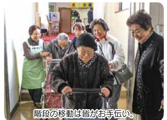
階段の移動は皆がお手伝い。

九戸村の産業文化祭りに出品する作品、今年はキャップアートで名画「モナ・リザ」に挑戦です。使ったキャップは400個。近くで見るとわからなくても、離れて見ると「顔だ!」と喜ぶ姿が印象的でした。文化祭には作品作りをした6名が見学に行きました。地域の人たちから声を掛けられたり、階段で移動のお手伝いをしてくれたりと愛情が感じられる場面が多々観られました。今年は九戸村の歴史が分かる展示もあり、関心を持ち見学されていました。