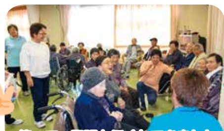
笑って、緊張もほぐれてきました。