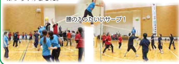
腰の入ったいいサーブ!

9月28日に二戸地区介護保険事業者協議会主催のソフトバレーに参加しました。今年も3チームが参加しました。上位入賞はできませんでしたが、プレイはもちろん、応援もはっちゃけました。