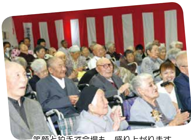
笑顔と拍手で会場も、盛り上がります。