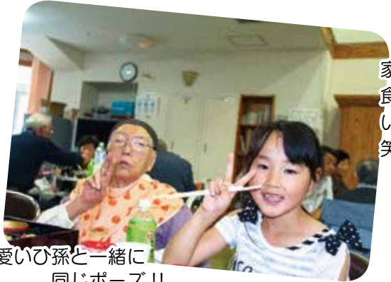
可愛いひ孫と一緒に 同じポーズ!!