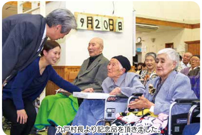
丸戸村長より記念品を頂きました。