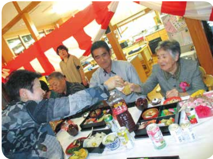
たくさんの家族の方から参加いただき、入居者の方も一緒にお祝いできて、大変喜んでいました。