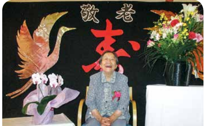
93歳のTさん、グループホームの元気な最高齢です！「健康第一」がTさんの口癖です。いつまでも元気で長生きして下さいね。

今年もたくさんの家族の方や来賓の方に来ていただき、賑やかにお祝いすることができました。入居者皆さんの笑顔もたくさん見られました。