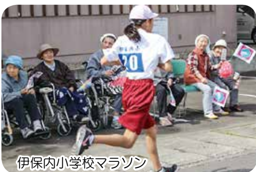
伊保内小学校マラソン

9月24日、毎年恒例の伊保内小学校のマラソンの応援をしました。走る姿に「元気」をもらいました。