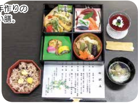
厨房職員手作りの お祝い膳。