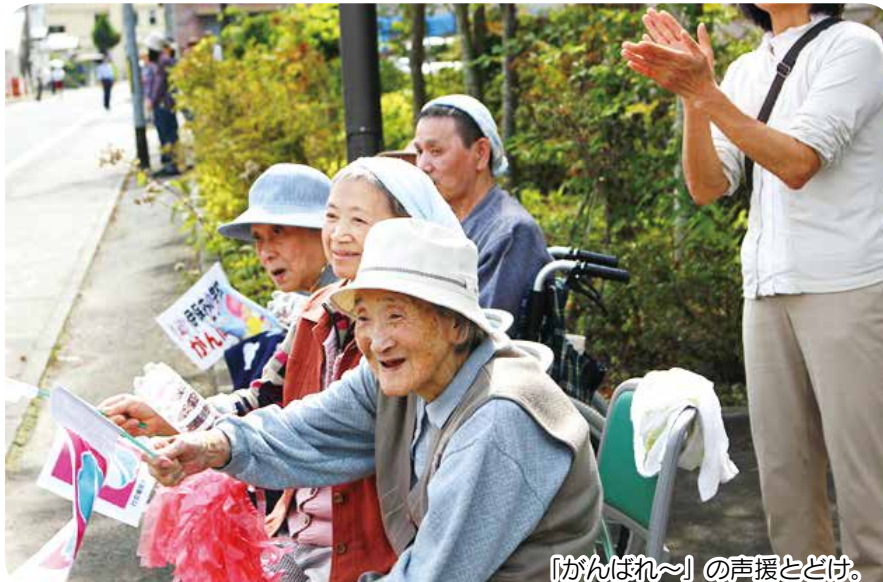
「がんばれ〜」の声援とどけ。