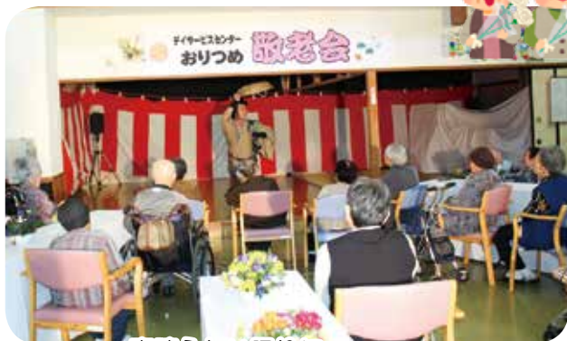
素晴らしい踊りに 皆さん真剣に見入っています。