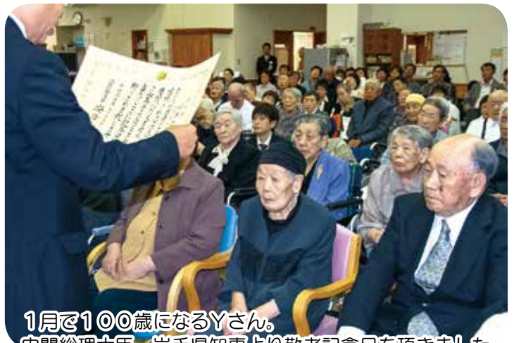
1月で100歳になるYさん。 内閣総理大臣、岩手県知事より敬老記念品を頂きました。